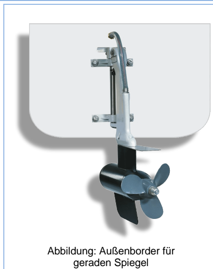
Abbildung: Außenborder für geraden Spiegel

Mit der praktischen Einhebelbedienung ist eine stufenlose Drehzahlregulierung im Vor- und Rückwärtsgang möglich. Die hochwertige, elektrische Regelung arbeitet nahezu verlustlos und schützt Ihren wertvollen Batteriesatz gegen zu tiefe Entladung. Die moderne Leistungselektronik hilft, den Antrieb optimal an Ihr Schiff anzupassen.