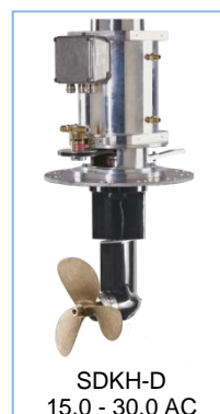
SDKH-D 15,0 - 30,0 AC