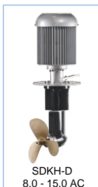
SDKH-D 8,0 - 15,0 AC