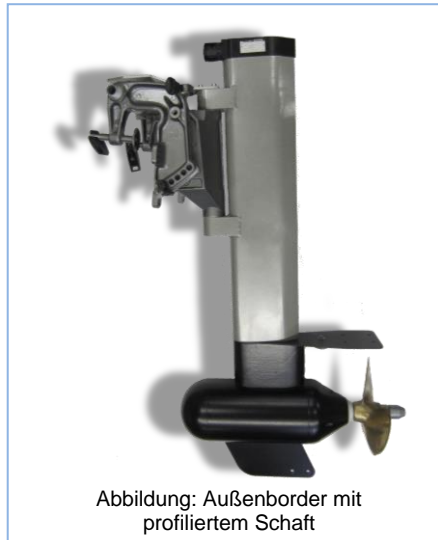
Abbildung: Außenborder mit profiliertem Schaft

Die Zukunft in der Antriebstechnik gehört dem Elektromotor. Neben dem höheren Wirkungsgrad eines Elektromotors gegenüber einem Verbrennungsmotor, punktet der Elektromotor durch seine Emissionsfreiheit. Ein zusätzlicher Vorteil ist der im Vergleich zum Verbrennungsmotor einfachere Aufbau und daraus resultierende geringere Anteil an Verschleißteilen.